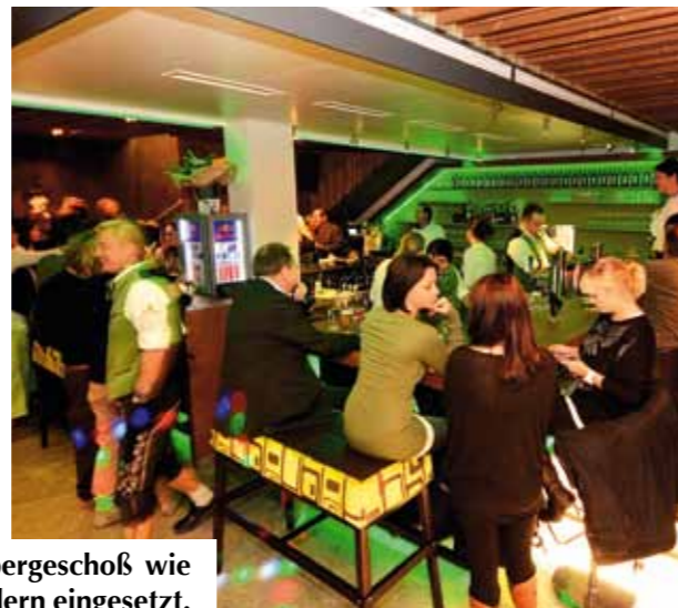
Der Jennerwein – das Erdgeschoß mit Natursteinfassade und das Obergeschoß wie ein transparenter Hochsitz. Innen wurden traditionelle Materialien modern eingesetzt.